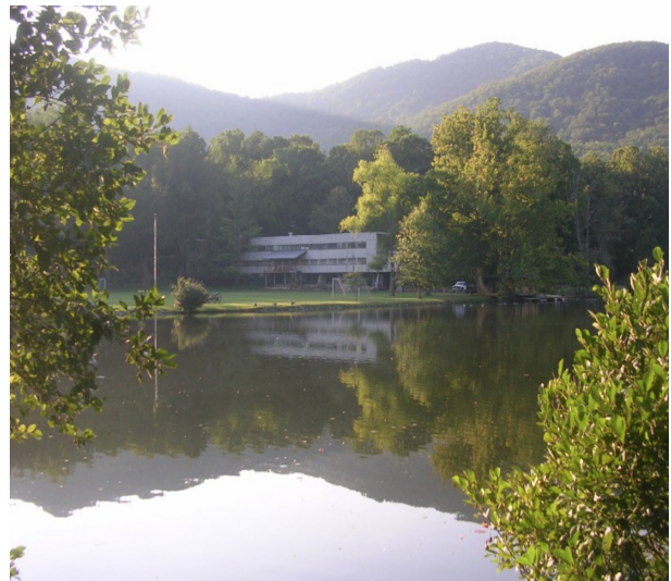
Abbildung 1: Blackmountain College

Die Idee einer Akademie für Kunst und Philosophie bietet nicht nur eine Alternative zu bestehenden Institutionen innerhalb und ausserhalb des Kantons, sondern will auch einen Horizont eröffnen, in dem Kunst nicht mehr als ‚nice to have‘, sondern als ‚need to have‘ erscheint. Ohne politisch zu sein, vertritt die AKuP den Anspruch, der Kunst ein grösseres Gewicht in der Gesellschaft zu verleihen. Sie orientiert sich an Vorbildern wie dem Bauhaus in Weimar/Dessau, der Alanus Hochschule in Alfter oder dem historischen Black Mountain College in North Carolina, die so bedeutende Namen wie Paul Klee, Wassily Kandinsky, Walter Gropius, John Cage oder Cy Twombly hervorgebracht haben, die Kunst als eine eigene Lebensform und -aufgabe begriffen.